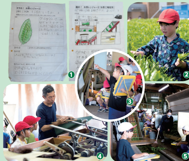
1. 児童たちが書いた授業の感想シート 2. 一生懸命にお茶摘みをする児童 3～5. 工場見学でたくさん新しい発見をした児童たち

この授業は、子どもたちが、お茶作りの大変さや工程を初めて知るきっかけになっているので、大人になっても地元の名産として石榑茶を覚えてほしいし、小学生のときにこういう経験をしたことも心に残るといいなと思いながら行っています。また、この授業は、子どもたちから、これはどうなっているんだろう？という疑問が、一番たくさん出ます。自分たちが楽しみながら、地域のことを知ることができるので、自分たちのまちが自然と好きになるのではないかと感じます。