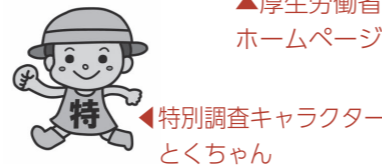
特別調査キャラクター とくちゃん