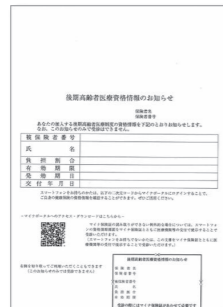
▲資格情報のお知らせ