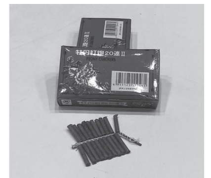
▲追い払い用の爆竹