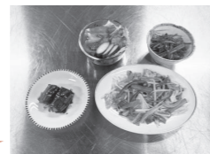
野菜 350g を調理した場合

いなべ市役所正面玄関付近には、野菜摂取レベルと推定野菜摂取量を測定できる機器を設置しています。お気軽に測定してください！