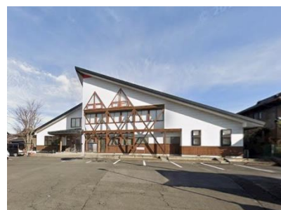
現在の商工会事務所 （ウッドヘッド）