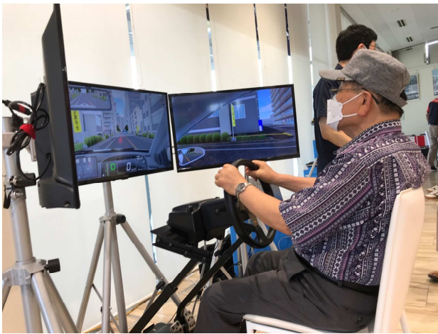
交通安全危険予測シュミレータ