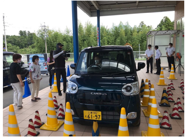
安全運転の心構え