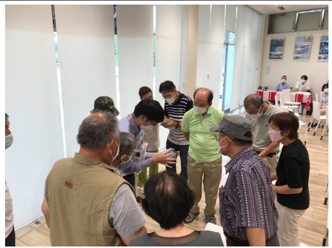
シェアカースマホ操作講習