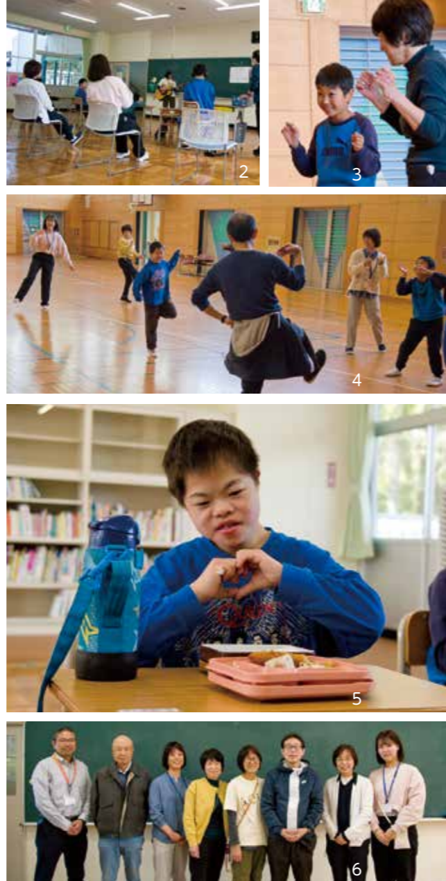
1.入学式の様子。グローブに向かって上手にボールを投げます 2.教室での様子 3.4.リズムに乗ってダンス。自分たちができる範囲で楽しみながら踊ります 5.大好きな昼食の時間。カメラを向けると手でハートを作ってくれました 6.教職員のみなさん

「障がいのある人たちの役割を創造し、共生社会の実現をめざす学校づくり」を理念に、小学部から高等部専攻科まで16年間の教育課程を持つ本校。児童生徒の卒業後の生活を見据えて、一人一人の可能性を広げていくことを大切にしている教職員たちの想いを紹介します。