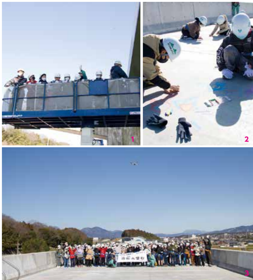
1. 高架橋の高さは約20m。みんなに手を振られながら登っていきます 2. 色とりどりのチョークを使って、自分の好きなものを描く 3. みんなで見上げて、はいチーズ！

開通前だけの特別な体験 3月7日(木)、治田小学校の4～6年生が東海環状自動車道の大安IC～いなべIC(仮称)間にある高架橋を見学しました。工事の内容や注意事項を勉強してから、高所作業車に乗って高架橋に移動。ゆっくりと地面を離れ登っていくと、児童たちは「おおー！」と声をあげながら大興奮していました。高架橋に到着したら、道路にチョークでお絵かき。そのあと、全員でドローンカメラで記念撮影を行いました。見学会を開催した施工業者の担当者は、「普段は歩けないところなので、これから車で通るときに今日のことを思い出してほしい」と話していました。