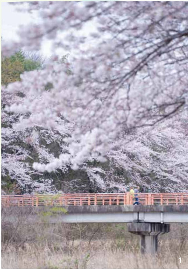
1. 宇賀川沿いの桜 (大安町) 2. 北勢線とネモフィラ (三岐鉄道北勢線大泉駅近く) 3. 花壇のパンジー (郷土資料館前)