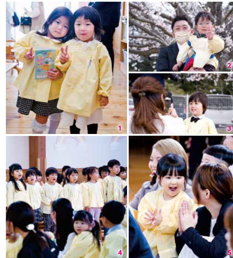
1. 新しい連絡帳を持って 2,3. 入園式の日には園庭の桜が見ごろに。桜の木の下で記念撮影 4,5歳児たちは元気いっぱい歌って3歳児を歓迎 5. 保育士との手遊びの時間では、緊張も解けて笑顔に

山郷保育園で入園式 4月5日(金)、山郷保育園で入園式が開かれました。保護者に付き添われて遊戯室に入場した3歳児を4、5歳児たちが歌で歓迎して、にぎやかな入園式に。今年は4年ぶりに在園児も参加して、大勢で入園児を祝いました。森夏美園長は「みんなが来るのを待っていました」と呼びかけ、「元気に登園してほしい」と伝えていました。最初は緊張して保護者の手を握っていた園児も、保育室に入るころには笑顔が見られました。これから、保育園で楽しい思い出を作ってね。