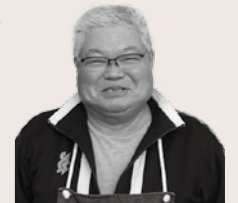
北勢粗大ごみ場 川瀬 信光

分別した状態で搬入してください 未分別で搬入されると、搬入物の確認に時間をとられ、スムーズに受け入れを行うことができません。そのため、品目別に分別して搬入してください。