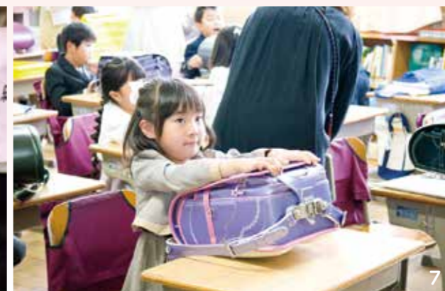
1. お母さんと一緒にいると、緊張もほどけてにっこり 2. 式の入場前。6年生が案内してくれました。記念にはいチーズ！ 3. 色とりどりのランドセル 4. 式の様子。名前を呼ばれて「はい！」 5. 式後、みんなで記念撮影。撮影スタッフがたくさん笑わせてくれました 6. 教室で先生の話をしっかり聞きます 7. 早くランドセルを背負いたい！ 8. ランドセルに教科書を入れます。勉強がんばるぞ！