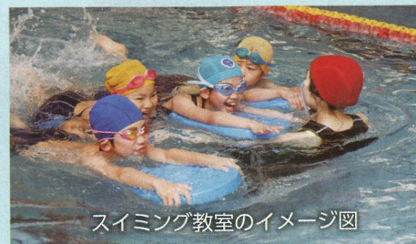
スイミング教室のイメージ図

公募で選ばれたTAC・テルウェル共同事業体が指定管理者として、管理と運営をします。小学校の水泳授業や各種教室では、インストラクターによる指導を受けることができます。