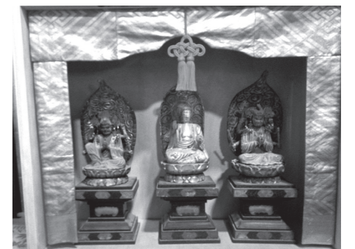
明源寺の平安時代の仏(藤原町東禅寺)

西野尻は、平安時代の初めに、参議藤原仲成が朝廷のおとがめを受け、袴腰(藤原岳の古称)の山中に隠れ住んだと言われています。