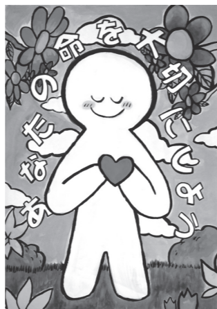
黒木 かおる (笠間小学校 6年)