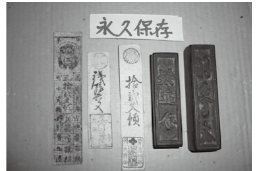
忍藩の藩札(西岸寺蔵)(大安町平塚) 藩札は、藩内でのみ流通していた紙幣です。

明治22年に高柳、平塚と石樽下が合併して三里村が誕生しました。この地域は、「3つの村」が合併してできたので三里村と名づけられました。村役場は了園寺の南側に設置されていました。三里村には、「楮」 こうぞ 「尼ヶ谷」 あまがたに という古墳群跡があり、古くから人々が住んでいました。江戸時代後期は石樽下は桑名藩、高柳と平塚は忍藩(現在の埼玉県)に属していて、忍藩の藩札は郷土資料館に保存されています。高柳の由来は、宗泉寺の境内に大きな柳の木が植えられていたからと伝えられています。この寺は、奈良時代に建てられ、その昔は30名も修行僧がいた大寺でした。現在は、自治会で管理されています。平塚には「楮」という地名があり、紙の原料となる楮を栽培して伊勢神宮に納めていました。石樽下には「山神橋」 やまかみばし があります。この場所には当時、山の神がまつられていたと伝えられています。