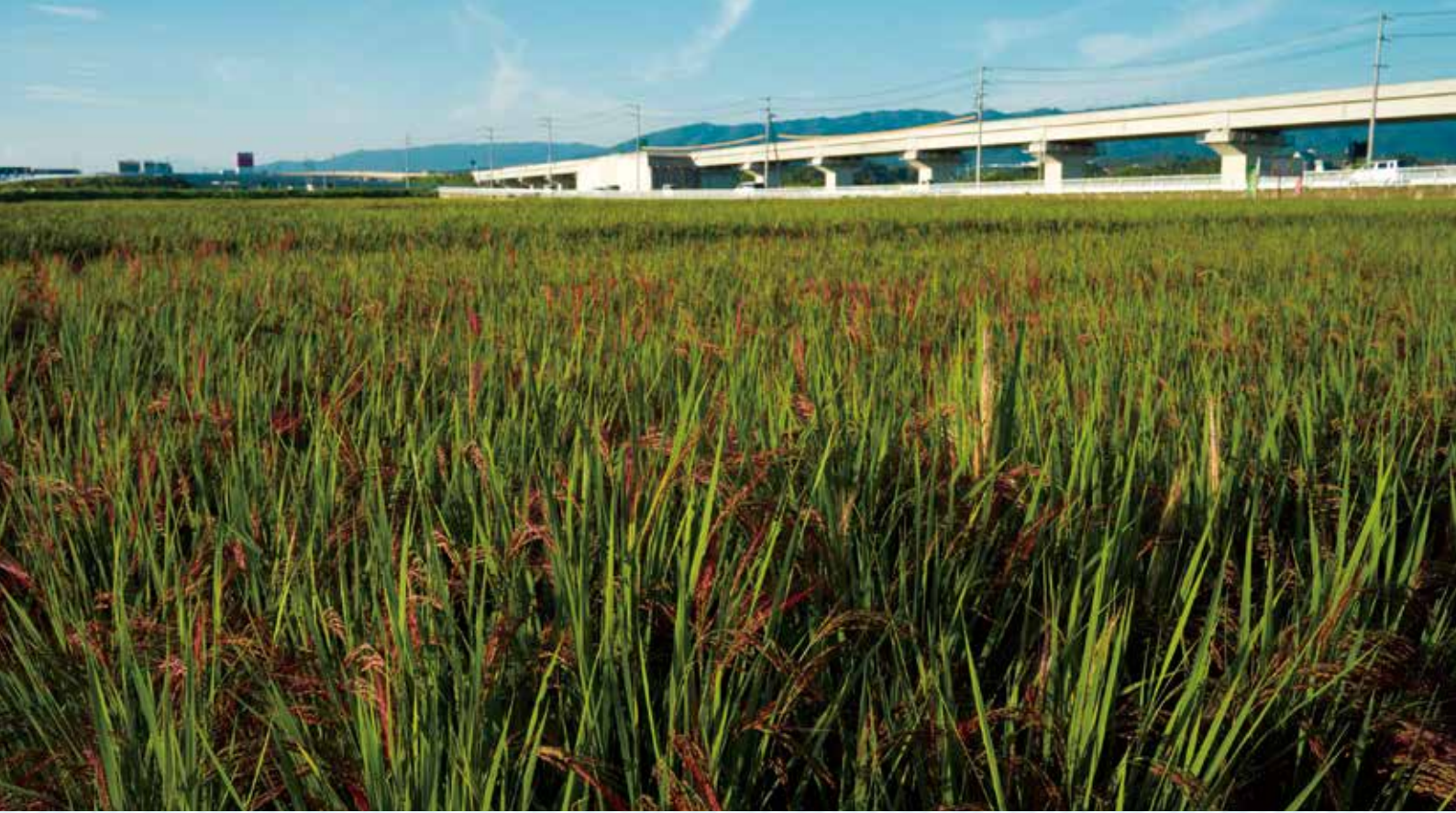
▲赤く色づく大安桜米(大安町高柳)