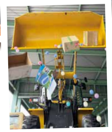
参加景品のトラック型ペンケース