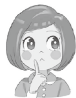
ことちゃん いなべ市認知症 応援キャラクター

その人は認知症で、自分が今どこにいるのかわからなくなっているのかもしれないわね。そういうときは、①正面から②ゆっくりと優しい口調で③答えをせかささないようにして、話を聞いてね。名前や住所を尋ねても答えられないときは、無理に聞き出そうとせず、名前や連絡先などを書いたものを持っていないか本人に聞いてみましょう。ほかにも、服や靴などに「QRコードワッペン」が貼ってないか、さりげなく観察してね。