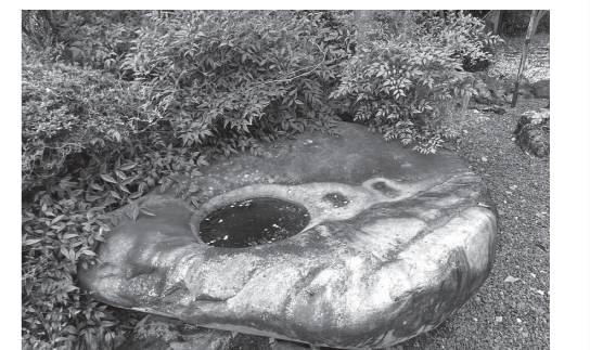
新町神社の手洗い鉢(北勢町新町)

各地の名前には、それぞれ由来があります。奥村は、深い山に囲まれていることからその名が付けられました。麓村は、寺山や城山の麓に位置するのが名前の由来です。垣内は、垣で囲まれた土地を表し、治田郷の総宮賀毛神社の鎮座地であることから、神垣を表していると考えられています。東村は、郷内の東に位置し、かつて東友と言われていました。別名は、この土地を開墾した人々が、別の場所に居住していたことから付けられました。新町は慶長(1596～1615)の初めごろ、鉾山の開発のために移り住んだ人々で形成された村です。中山は、治田村と丹生川村の中間に位置したためその名が付けられました。中山には、安行寺があり、その鐘楼堂には、桑名城の本丸と三の丸御殿の唐破風門が移築されています。