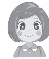
ことちゃん いなべ市認知症 応援キャラクター

ひいおばあちゃんは、いつも診てもらっている先生の紹介状を持って、物忘れ外来に行き、お薬をもらってきたよ。物忘れが増えてずっと不安だったんだって。先生とこれからのこととかをお話して、少し安心したみたい。