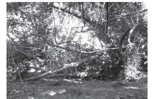
樹権の木(いなべ市指定天然記念物)(南中津原) 樹齢800年を超えるといわれ、昭和37年日本の名木に指定されています。

鼓はその昔「鼓ヶ原」と言い、堤が変化したのではないのでしょうか。中津原は昔「中ッ国」と言われ、人口増加により寛永12(1635)年に北と南に分村しています。平野新田、大辻新田は台地のために水が少なく、多くの水田を作るために、古くからマンボがたくさん作られ(慶安年間1650年頃)、人々が住み始めました。平野新田の地名は藩主松平定綱公の「平」と開拓地西野の「野」を合わせ「平野新田」と寛永14(1637)年に命名されたと伝えられています。大辻新田は、宝暦6(1756)年に鼓の庄屋が原野であった楚里野を開墾しました。其原の住民は、山田川の近くに住んでいましたが、度重なる水害のため高台の現在地に移動しました。麻生田には由緒ある古墳が存在し、奈良時代に朝廷や神宮に麻を献上した歴史があります。