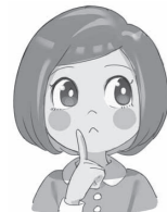
ことちゃん いなべ市認知症 応援キャラクター

認知症予防の最も効果的な方法の一つに運動があげられます。運動は、脳の老化を遅らせるタンパク質の分泌を促し、年齢とともに縮む脳を大きくして記憶力を高めます。おすすめの運動は、30分以上のウォーキングを週に5日以上行うことです。足腰が痛くて難しい人は、エアロバイクをこぐのもいいですね。