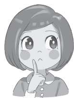
ことちゃん いなべ市認知症応援キャラクター

そうよ。認知症は高齢者が発症するものと思われがちだけど、18歳から64歳までに認知症疾患を発症する事もあり、総称して若年性認知症って言うのよ。現役世代での発症だから、仕事や家庭、子どもへの影響なども大きく、周囲の理解がとても重要。三重県若年性認知症サポートセンターでは、本人や家族が安心して過ごせるよう、その特性に合わせた助言や支援をしたり、若年性認知症の本人たちで作る「レイの会」とともに活動しているよ。