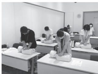
▲救命講座のようす