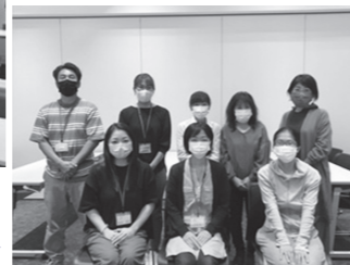
養成講座の参加者▶