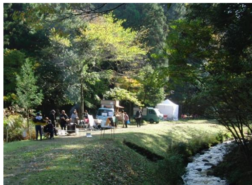
【里山を活用したプログラムの例】 (令和4年実施:グリーンインフラ関連イベント)