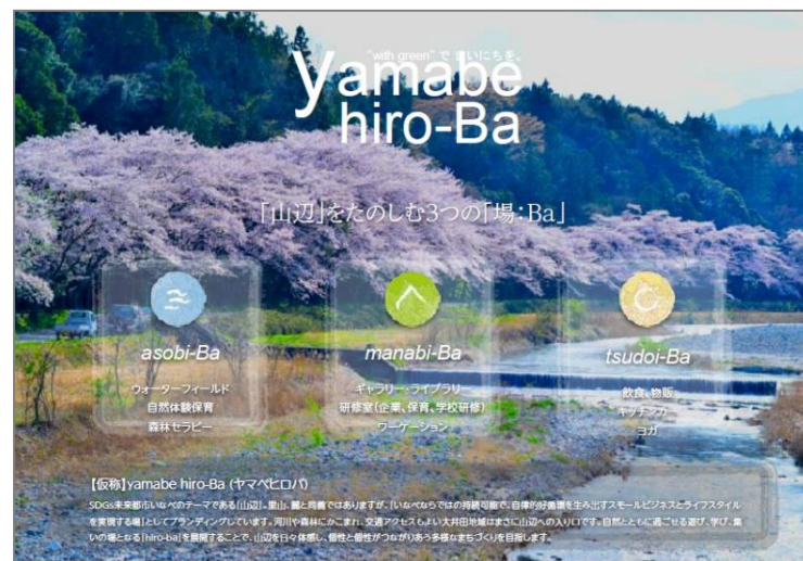
【事業コンセプト図】