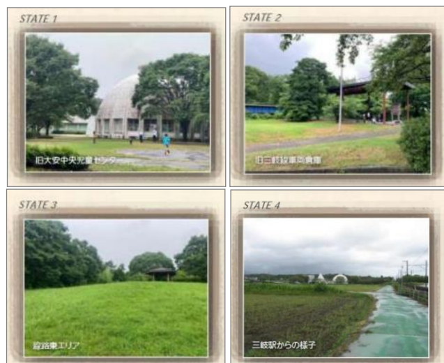
【現況写真(既存建物等)】