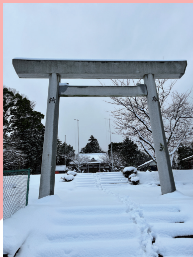
▲川原丸山神社。お正月過ぎ。拝殿までが遠くに感じる積雪。よく降りました。(北勢町 一木美奈子 58)