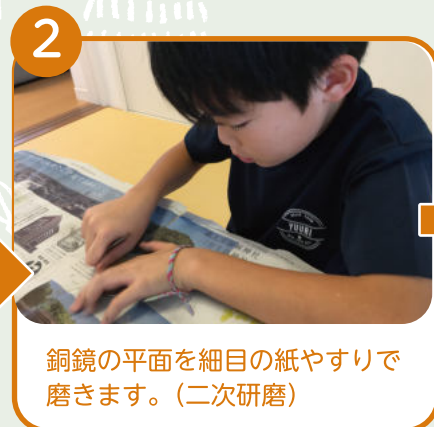
銅鏡の平面を細目の紙やすりで磨きます。(二次研磨)