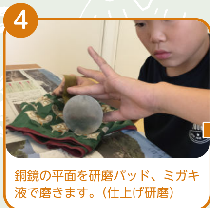
銅鏡の平面を研磨パッド、ミガキ液で磨きます。(仕上げ研磨)