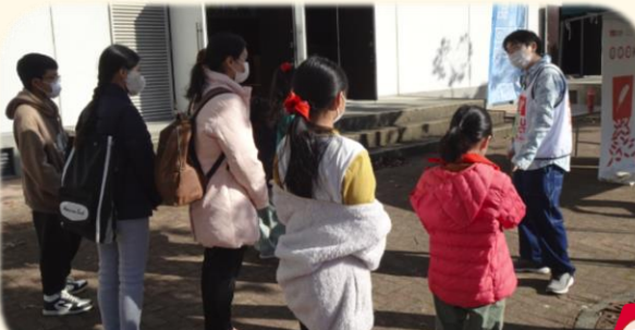
羽毛ふとんの回収コーナー