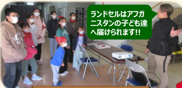
ランドセル回収コーナー