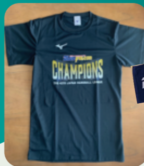
ハンドボール部 ブルーファルコン 日本リーグ優勝記念Tシャツ、 タオルなど