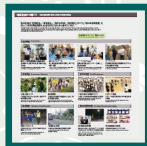
社会貢献活動の紹介

エアバッグなどの端材を活用した商品（Re-S） (トートバッグ、ペン立て、ペンケースなど)