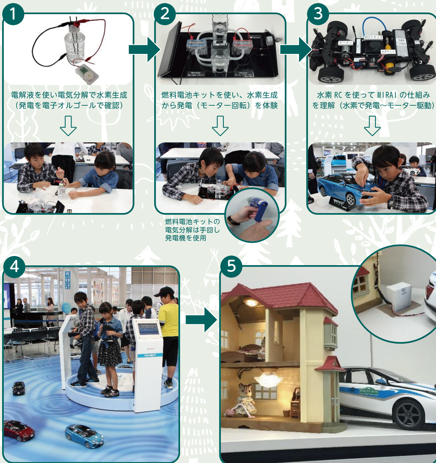
MIRAI の動く仕組みを学んだあとは、RC 操縦体験！