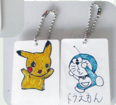
キーホルダー作り