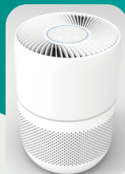
UVC 空間除菌装置 (深紫外 LED 使用)