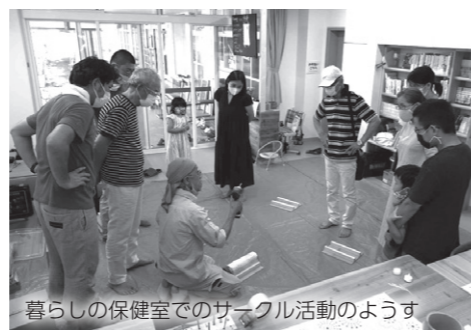
暮らしの保健室でのサークル活動の様子