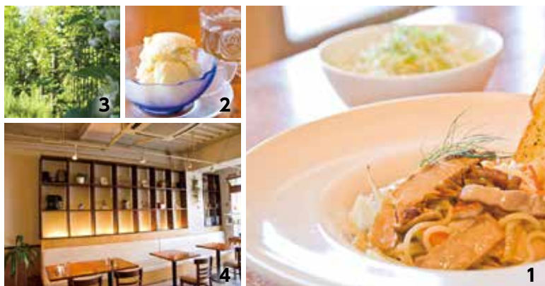
1. もちもちの生パスタ。材料から手づくり 2. 手作業でむいたはっさく入り ジェラートと自家製ハーブティー 3. POPO 畑 4. 店舗内観