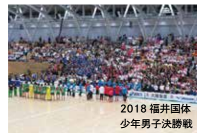
2018 福井国体 少年男子決勝戦