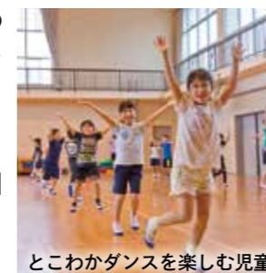
とこわかダンスを楽しむ児童

当日は、マスコットキャラクター「とこまる」も登場し、一緒に楽しく踊ってくれました。