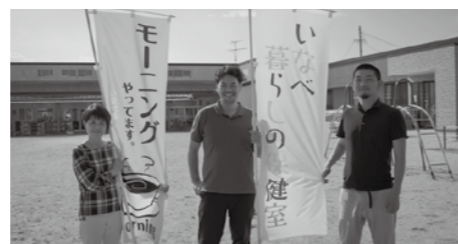
いなべ暮らしの保健室スタッフ