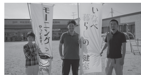
いなべ暮らしの保健室スタッフ