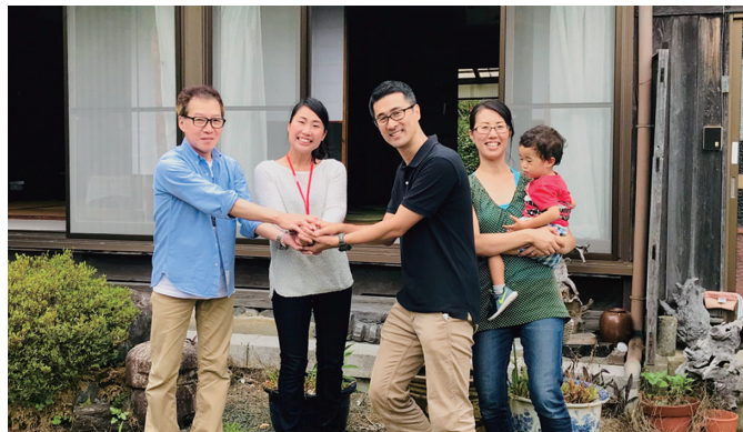
市内空き家の賃貸契約成立時の様子