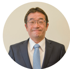
いなべ市副市長 岡正光

いなべ市が、より誇りと愛着を持てるまちとなるよう、誠心誠意努力してまいりますので、皆さまのご指導、ご鞭撻を賜りますようお願い申し上げます。