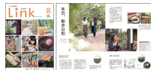
広報紙部門(市部) 2019年8月号