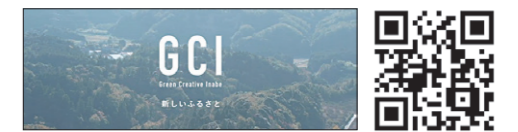
映像部門 「グリーン・クリエイティブ・いなべ」