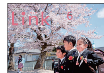
写真部門(一枚写真) 2019年6月号