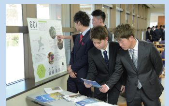
成人式でのPRの様子