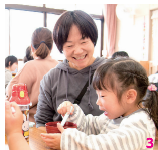
1. 皿回しに見入る 2. 太鼓の演奏 3. ぜんざいのふるまい