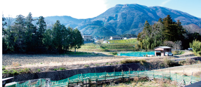
藤原岳 (藤原町下野尻)