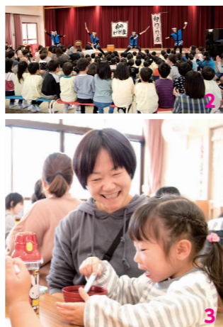
1. 皿回しに見入る 2. 太鼓の演奏 3. ぜんざいのふるまい

出し物のあとは、センターでぜんざいのふるまいがありました。子どもたちは汁の中に入っていたあられをスプーンで上手にすくって食べ、「おいしい」と話していました。