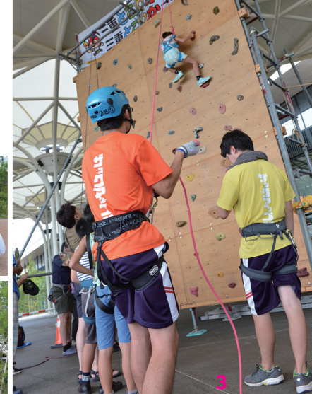
1.おしゃれなテントで記念撮影2.ワークショップブース3.約5メートルの壁をクライミング。子どもから大人まで、100人以上が参加