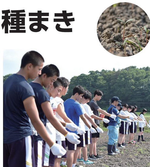
地域の企業も参加し種まき

今年は昨年よりも種まきの面積は大きく、規模も東海地区最大級となりました。満開になれば北勢線の線路付近まで花が咲きます。ひまわりは9月中、コスモスは10～11月を目安に満開になる見込みです。観光や写真撮影などに足を運んでみてください。