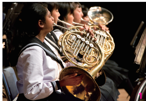
1. 息の合った演奏が会場に響く 2. 三重県吹奏楽コンクール中学校C編成での金賞受賞曲を披露

楽器を寄附した市内の男性は「素晴らしい演奏で、後半は客席に部員が来てパフォーマンスをするなど、会場が一体となりました」と話していました。