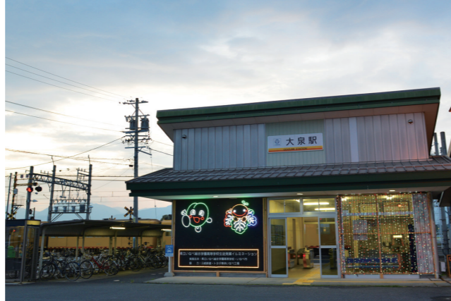
大泉駅のイルミネーション (員弁町大泉)