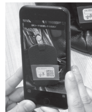
スマートフォンなどでQRコードを読み取ると右のような表示画面がでます。

◆三重県いなべ市 SOS ネットワーク 身元が分からないときは最寄りの警察署か下記に連絡をお願いします。 記