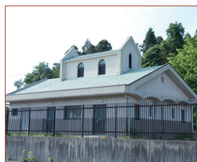
北勢町貝野川右岸地区クリーンセンター。部分的に弧を描くデザインが目を引く