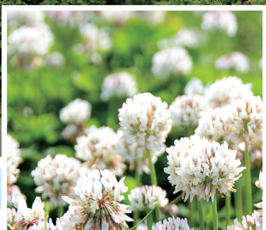
田植えを終えた田んぼのそばで咲くシロツメクサ

田畑や川の間ぎゅっと住宅が集まった北勢町飯倉。麦畑を揺らす風に誘われ歩くと、季節の移り変わりを感じる発見がありました。