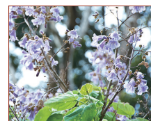
キリ。花の見ごろは過ぎていたが青々とした葉が残る