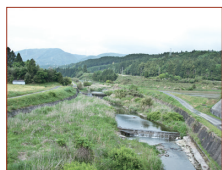
生命力あふれる緑のなかを流れる貝野川