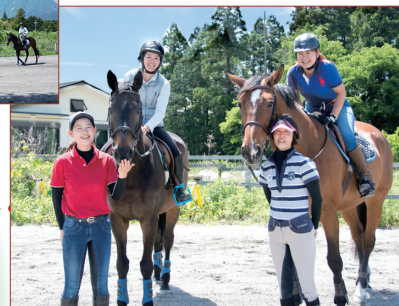
北勢ライディングファーム従業員の皆さん。ここでレッスンをする選手がとこわか国体に出場するかも…?