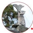
慈光院の屋根の鯨