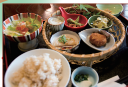
「自然食干とせ」のランチ。季節の野菜を中心に体に優しい素材ばかり