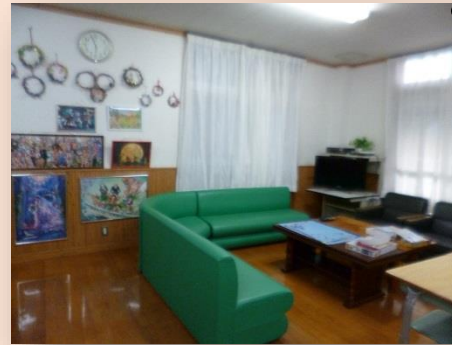
たもくできるこむ 多目的ルーム