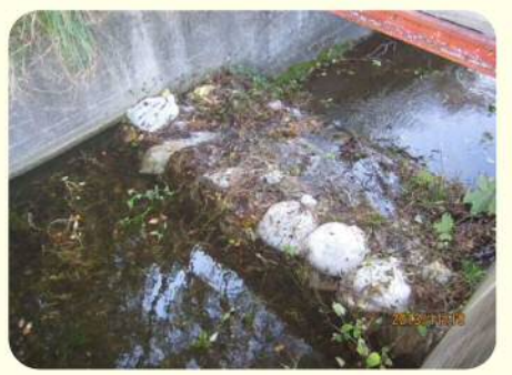
土のうによる洪水吐のかさ上げ

地震により発生した堤防の亀裂に浸水し、2～3日後に堤防が決壊する危険性があることが、過去の震災調査で判明しています。このため地震発生後、安全を確保した上でため池の水位を2m程度下げてください。また、天気予報により大雨が予想される場合についても、営農に支障のない範囲で水位を下げてください。