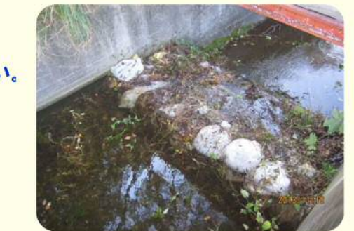
土のうによる洪水吐のかさ上げ

地震により発生した堤防の亀裂に浸水し、2~3日後に堤防が決壊する危険性があることが、過去の震災調査で判明しています。このため地震発生後、安全を確保した上でため池の水位を2m程度下げてください。また、天気予報により大雨が予想される場合についても、営農に支障のない範囲で水位を下げてください。