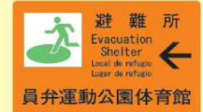
避難所には案内看板があります。

いなべ市では、避難所を20箇所指定しています。避難が必要と判断された場合は、市役所から防災ラジオなどにより発令します。