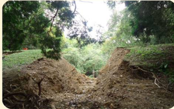
大雨により決壊したため池

このため、ため池が決壊した場合に想定される浸水被害の範囲や避難場所などの情報を分かりやすく地域住民の方々に提供することを目的として、「ため池ハザードマップ」を作成しました。この「ため池ハザードマップ」により、浸水区域や避難場所を事前に把握し、安全な避難活動にご活用いただくとともに、「ため池ハザードマップ」を通じて日頃の防災意識の向上や地域の防災情報の共有などにお役立てください。