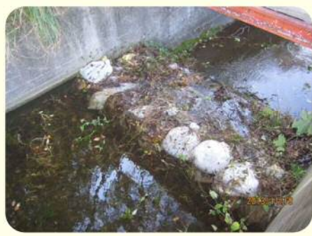
土のうによる洪水吐のかさ上げ

地震により発生した堤防の亀裂に浸水し、2～3日後に堤防が決壊する危険性があることが、過去の震災調査で判明しています。このため地震発生後、安全を確保した上でため池の水位を2m程度下げてください。また、天気予報により大雨が予想される場合についても、営農に支障のない範囲で水位を下げてください。