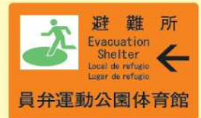
避難所には案内看板があります。

いなべ市では、避難所を20箇所指定しています。避難が必要と判断された場合は、市役所から防災ラジオなどにより発令します。