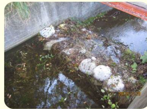
土のうによる洪水吐のかさ上げ

また、ため池の貯水量を増やすために、洪水吐に土のうを積む様子がよく見受けられますが、これも危険ですので止めてください。