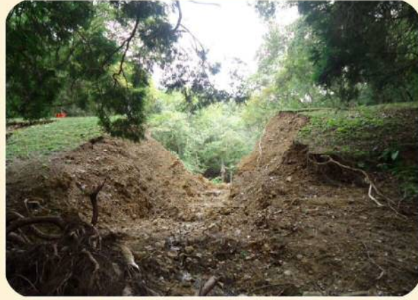
平成25年9月、台風18号による大雨により決壊したため池

ため池は全国におよそ21万箇所あり、古くから農業用水の貯水池として利用されてきましたが、その多くは築造から100年以上が経過し、老朽化が進行しています。さらに、近年多発している局地的な大雨