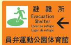
避難所には案内看板があります。

いなべ市では、避難所を20箇所指定しています。避難が必要と判断された場合は、市役所から防災ラジオなどにより発令します。