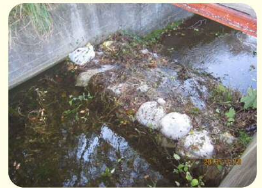
土のうによる洪水吐のかさ上げ

また、ため池の貯水量を増やすために、洪水吐に土のうを積む様子がよく見受けられますが、これも危険ですので止めてください。