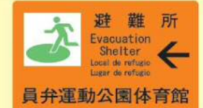
避難所には案内看板があります。

いなべ市では、避難所を20箇所指定しています。避難が必要と判断された場合は、市役所から防災ラジオなどにより発令します。