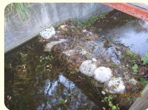
土のうによる洪水吐のかさ上げ

また、ため池の貯水量を増やすために、洪水吐に土のうを積む様子がよく見受けられますが、これも危険ですので止めてください。