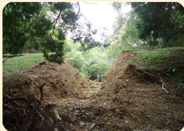
平成25年9月、台風18号による大雨により決壊したため池

ため池は全国におよそ21万箇所あり、古くから農業用水の貯水池として利用されてきましたが、その多くは築造から100年以上が経過し、老朽化が進行しています。さらに、近年多発している局地的な大雨