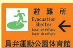
避難所には案内看板があります。

いなべ市では、避難所を20箇所指定しています。避難が必要と判断された場合は、市役所から防災ラジオなどにより発令します。