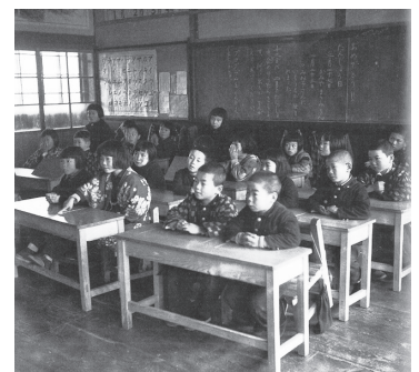
【昭和30年代の小学校授業風景】 男の子は坊主頭、女の子はおかっぱで冬は学生服の上に羽織を着てくる児童もたくさんいた。