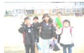
子ども見守りたい(隊)