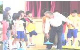
わくわくスクール