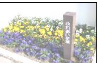
ふれあい花壇活動