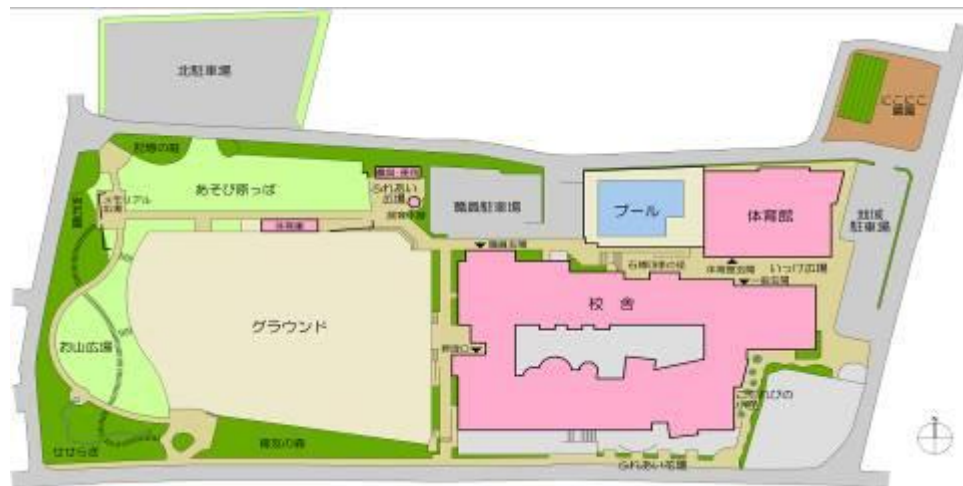
校地・校舎配置図