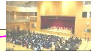
石博大すき! 1000人集合