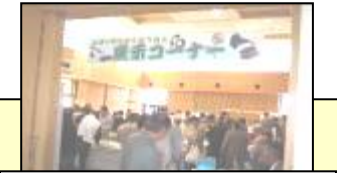
石小100周年記念事業