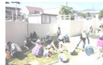
日曜地域清掃作業