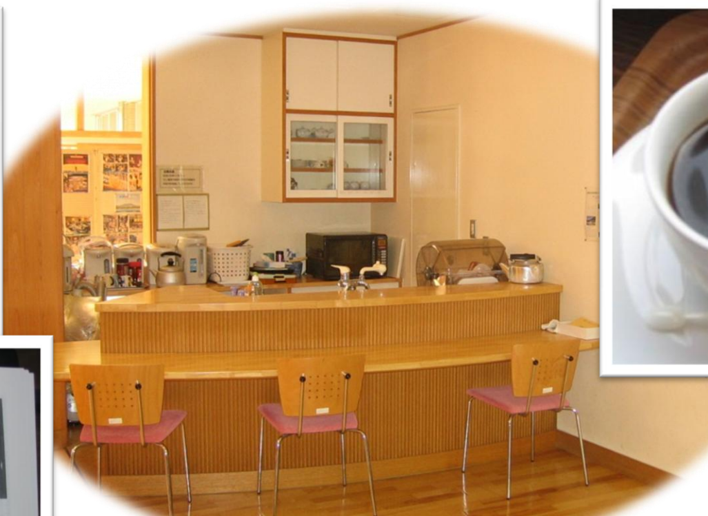
「石榑モーニング」暖かいお茶とお菓子でおもてなし