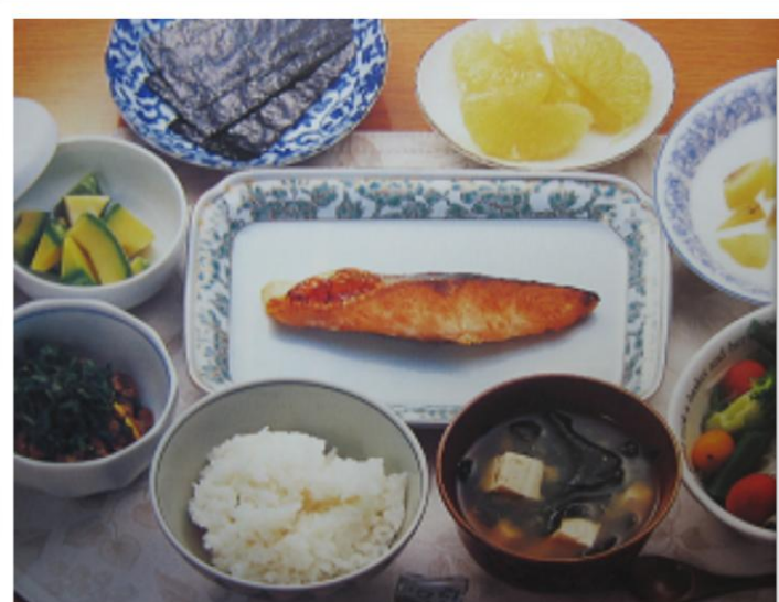
地味でも滋味！ 男の料理教室