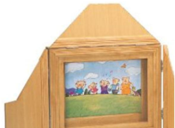
お母さんと一緒に紙芝居