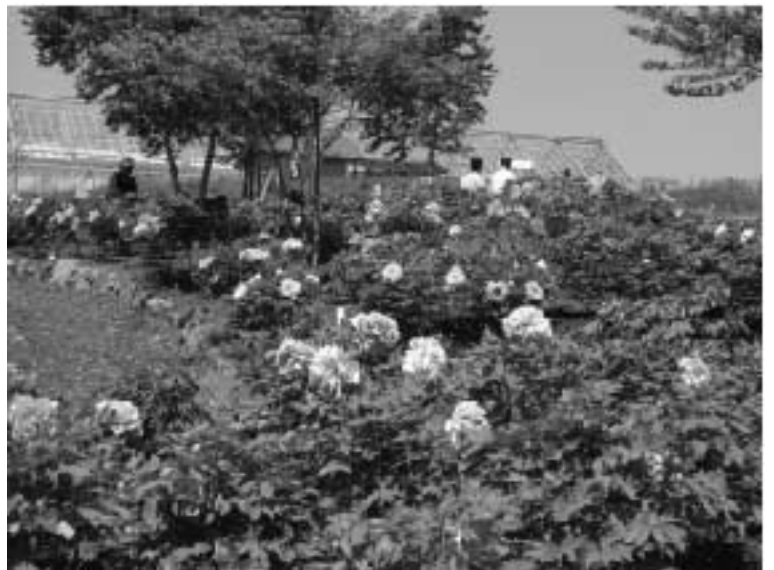
エコ福祉広場のぼたん