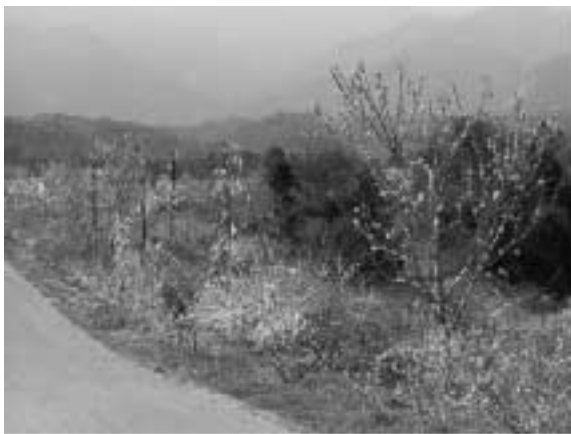
農業公園のレンギョウと花桃