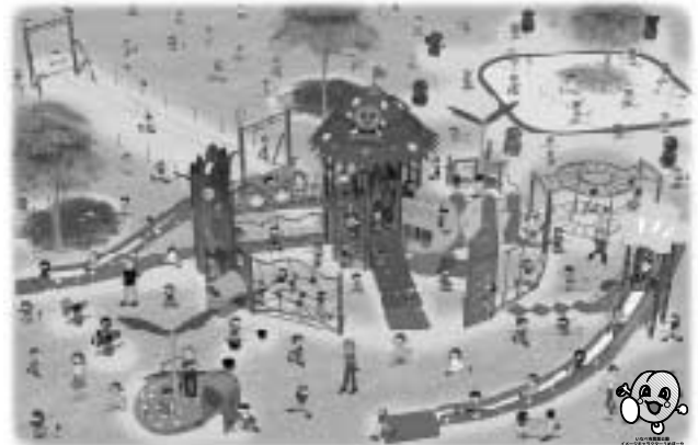
完成予想図 うめぼ～やのワクワクツリーハウス