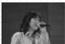
平成17年12月3日(土) 沢田知可子さんコンサート