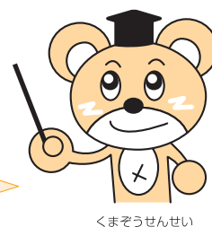
くまぞうせんせい