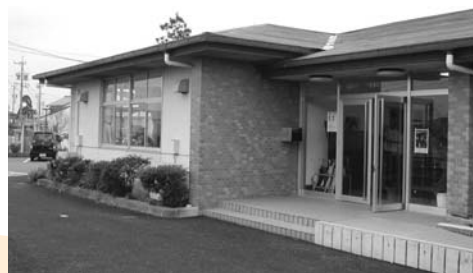
大安子育て支援センター外観