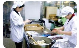
地元の素材をふんだんに使っています▲

営業 8:00~17:00 (火曜定休日) 場所 員弁町大泉2517番地(三岐鉄道 北勢線 大泉駅となり) ☎74-5826