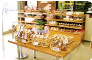
パンや惣菜も店内でつくっています▲