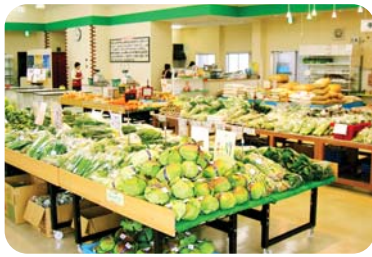
◀うりぼうの店内には豊富ないなべの農産物がたくさん並んでいます。

うりぼうは、消費者の健康志向や食の安全・安心への関心の高まりを背景に、地域で生産された農産物を地域で消費するという『地産地消』を理念に活動を行っています。