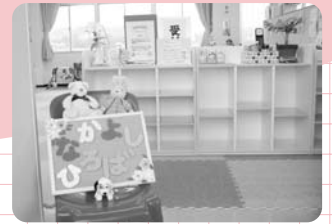
なかよしひろば 入り口▲

未就園の子どもさんと家族の方なら、どなたでもご利用できます。一度遊びに来てくださいね!