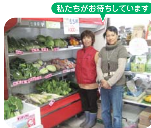
私たちがお待ちしております

営業 毎日 9:00~19:00 場所 いなべ市大安町宇賀 T/F 78-2249