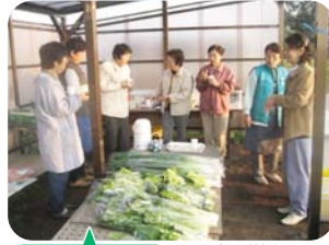
チョッと腹ごしらえ