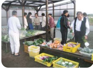
早朝からお客さんと販売しています▲