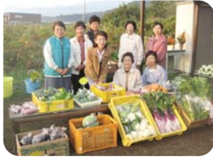
ふれあいモットーに!▲

施設は簡素ですが生産者と直接対話ができ、お客さんやメンバーとの情報交換の場として、それぞれ楽しくわいわいがやがやとしたアットホームな朝市が特徴です。