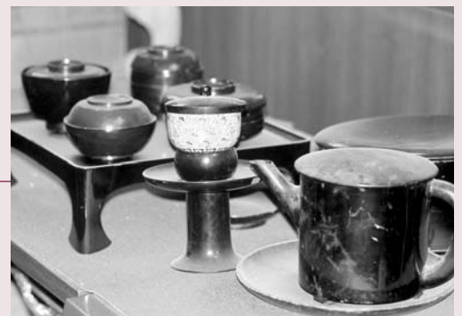
仏事用の器と膳(いなべ市郷土資料館所蔵)